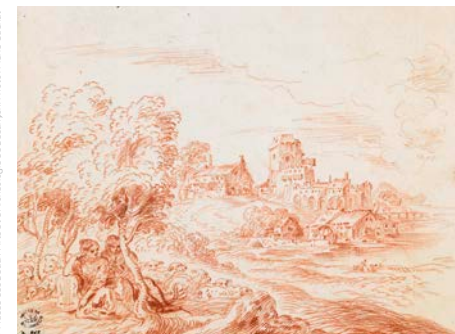
▲ Antoine Watteau, Paysage avec des musiciens assis sous des arbres, vers 1715, sanguine