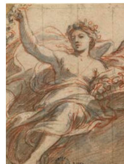
▲ Charles Le Brun, Flore, vers 1660, sanguine, pierre noire et lavis gris